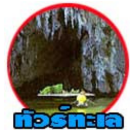
ทัวร์ทะเล