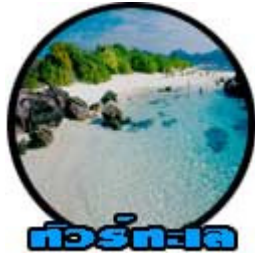
ทัวร์ทะเล