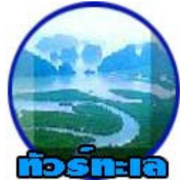
ทัวร์ทะเล