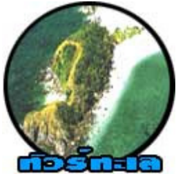
ทัวร์ทะเล

เดินทางได้ทุกวัน / *พักเพิ่มคืนละ 1200 บาท รวมอาหารเช้า (standard Room)